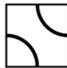
(b) B 形態